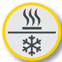
Системы обогрева и охлаждения